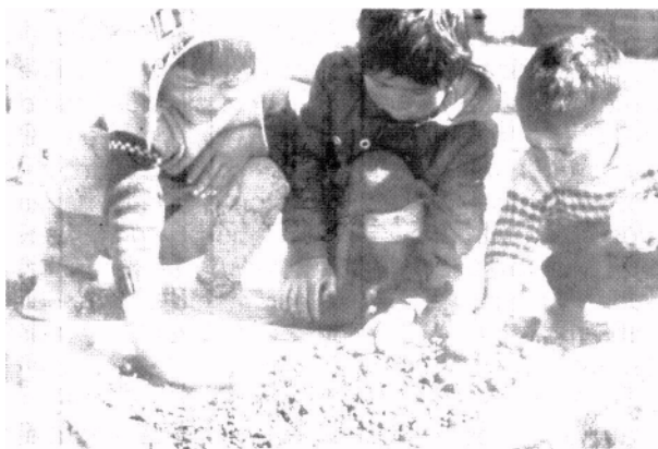
Figura 3. Niños de la Comunidad Piloto de Aymará, Junín, observando larvas y pupas del gorgojo de los Andes después de remover el suelo del almacén.

Para esto es importante ubicar lugares dentro de las comunidades o fincas donde se puedan hacer dichas observaciones. Por ejemplo, fue más fácil y efectivo ir con los agricultores a observar el insecto desarrollando sus actividades en un momento oportuno, que mostrar gráficos, figuras o fotos. Para observar la actividad del gorgojo de los Andes en su etapa adulta, los agricultores y extensionistas salieron por la noche provistos de linternas y pudieron observar la gran actividad de estos insectos dañinos. Luego fue fácil ubicar los huevecillos dentro de residuos de tallos de cebada, trigo u otras gramíneas cerca de las plantas de papa. En los almacenes de papa fue fácil encontrar larvas, pupas y adultos de polilla. La etapa larval de los insectos es generalmente la más conocida por los agricultores; pero ellos no conocían la relación de esta larva con el adulto y viceversa. Fue necesario remover una capa de suelo en lugares donde éstas habían caído para ver cómo se estaban transformando en pupas y luego en adultos (Figura 3).